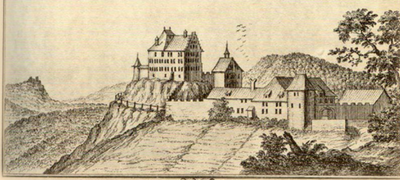
LIEBEGG. Schloß im Berner Gebiet.